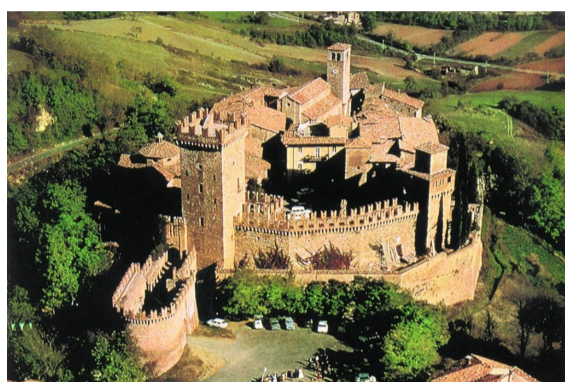
Il borgo di Vigoleno