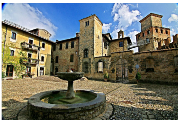
La fontana del XVI secolo