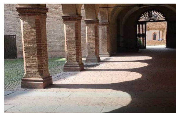
Fontanellato – Rocca di San Vitale, fossato, Santuario e piazza

Iscrizioni entro 05 maggio (iscrizione confermata solo con il pagamento della quota).